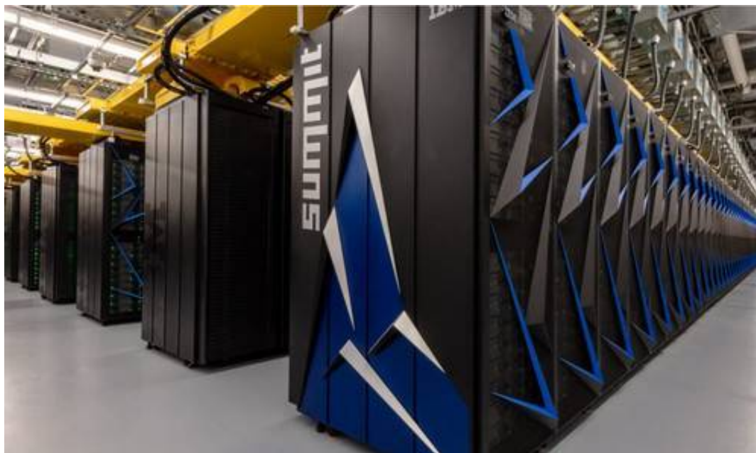
Le superordinateur Summit.

La course au superordinateur a remplacé la conquête spatiale. Dans cette compétition, comme partout ailleurs, l'UE censée faire le poids est totalement absente. Il est grand temps de relancer les coopérations entre États (comme Airbus) plutôt que de faire appel à cette structure bureaucratique kafkaïenne.